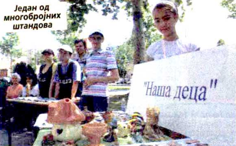
Један од многобројних штандова