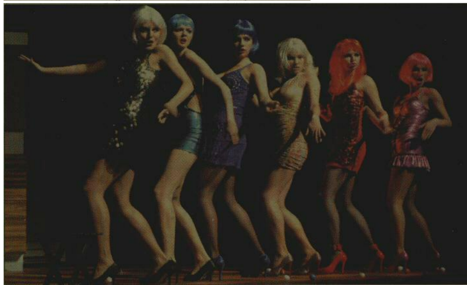
ЕСТРАДНО Сцена из представе "Сабља димисија"