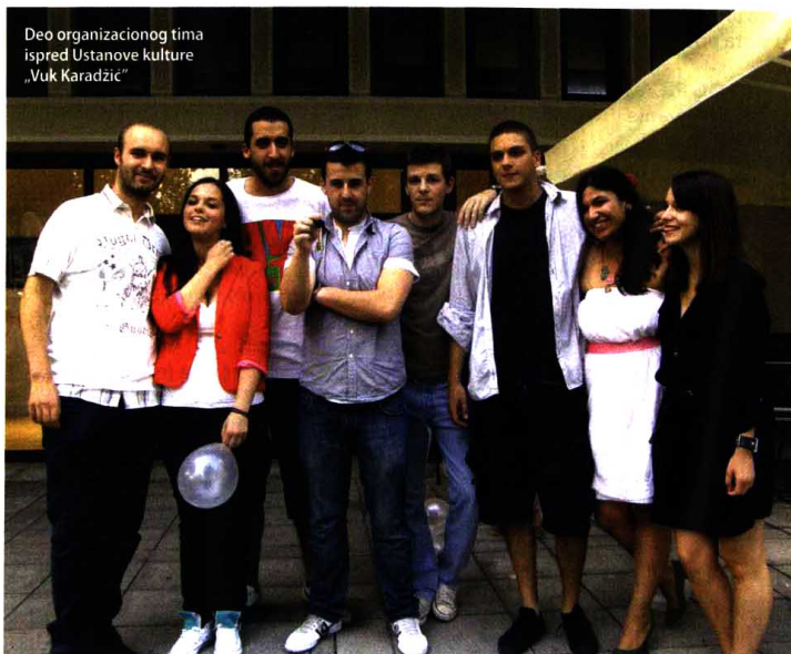
Deo organizacionog tima ispred Ustanove kulture „Vuk Karadžić“

Do polovine avgusta ključevi UK Vuk Karadžić u rukama su studenata FDU koji su dobili priliku da osmisle letnji program