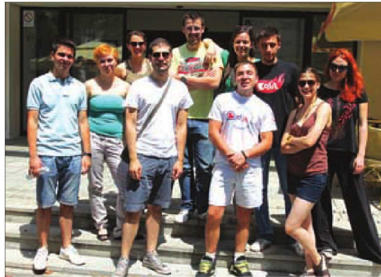
Uz pomoć kolega: Ansambel predstave „Mi, mladi u Beogradu“