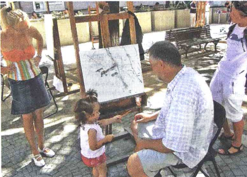
„Атеље на отвореном”