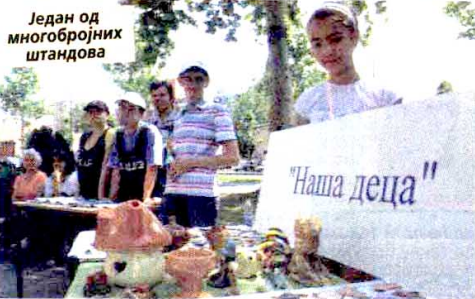
Један од многобројних штандова